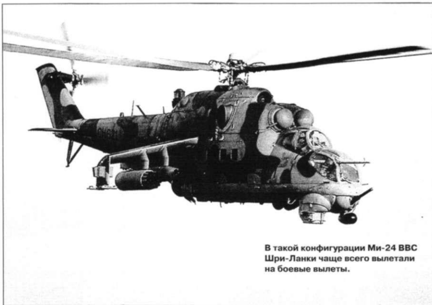
В такой конфигурации Ми-24 ВВС Шри-Ланки чаще всего вылетали на боевые вылеты.

В середине 1995 года на Украину (а именно на конотопский «Авиакон») отправилась внушительная делегация для оценки возможностей Ми-24. Вертолет ланкийским военным понравился, но финансовые возможности не позволяли приобрести партию машин, поэтому первоначально три Ми-24В были взяты в так называемый «мокрый лизинг» (вертолеты оставались в собственности Киева, мало того, украинская сторона брала на себя обязательства не только по полному обслуживанию техники, но и предоставляла экипажи и техников). 4 ноября 1995 года Ан-124 доставил на остров три вер-