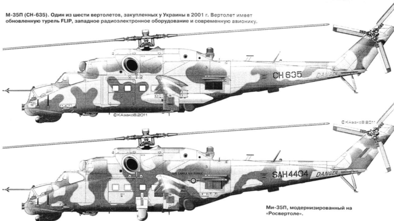
Ми-35П, модернизированный на «Росвертоле».

М-35П (CH-635). Один из шести вертолетов, закупленных у Украины в 2001 г. Вертолет имеет обновленную турель FLIP, западное радиоэлектронное оборудование и современную авионику.