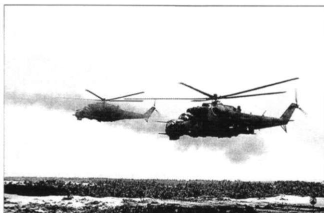
Слева: Пара ланкийских Ми-24 над джунглями. Справа: Атака пары Ми-24 (один из которых пушечный) на цель постанцев.