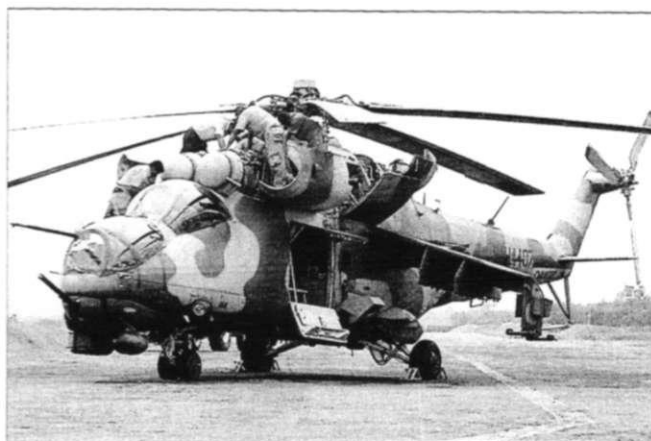
Слева: Ланкийский Ми-24 в ходе модернизации в сборочном цеху «Росвертола». Справа: Ми-24В продолжают оставаться основой 9-й эскадрильи ВВС Шри-Ланки.