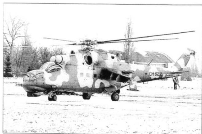
Слева: Ланкийский Ми-24П на боевом патрулировании. Справа: Ми-35 на чешском аэродроме Будейовице.