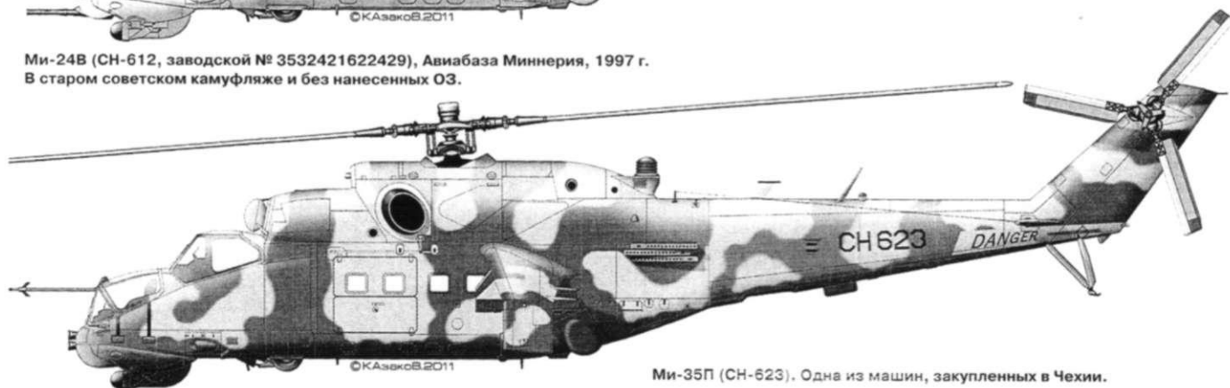
Ми-35П (CH-623). Одна из машин, закупленных в Чехии.

К середине марта 1996 года три Ми-24В налетали в ланкийских ВВС 180 часов (в декабре 1998 года возвращены на родину), а девять пилотов были полностью подготовлены для участия в боевых вылетах. Примерно с этого времени украинцы сосредоточились на инструкторской работе (последние из них покинули страну только в 2000 году).