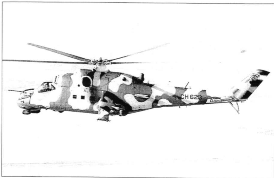
Облет Ми-35 чешским экипажем в ходе передачи ланкийской стороне.

Отметим, что все вылеты достаточно долго выполняли только украинские экипажи, так как подготовка «местных кадров» (пятерых пилотов и 26 техников) велась от случая к случаю – во время затишья в боях. Вертолетчиков переучивали с Bell 212 – обычно для этого хватало примерно 18 часов занятий.